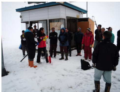
実際の救助方法の説明