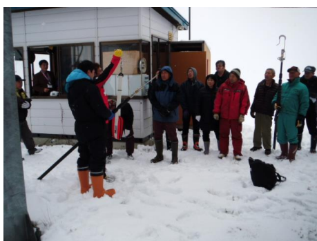
救助用具の取り扱い方法説明